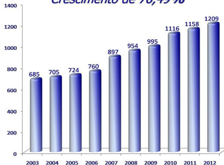
Figura 2- Produção e Consumo de Sorvetes no Brasil

A ICECREMEL indústria de alimentos gelados mais precisamente picolés, terá como estratégia a manufatura de “Picolés Artesanais”, produtos este com a mais alta qualidade nutricional e sabor, comprometendo-se a desenvolver sabores diferenciados, sempre respeitando tendências de mercado mediante pesquisa realizada periodicamente.