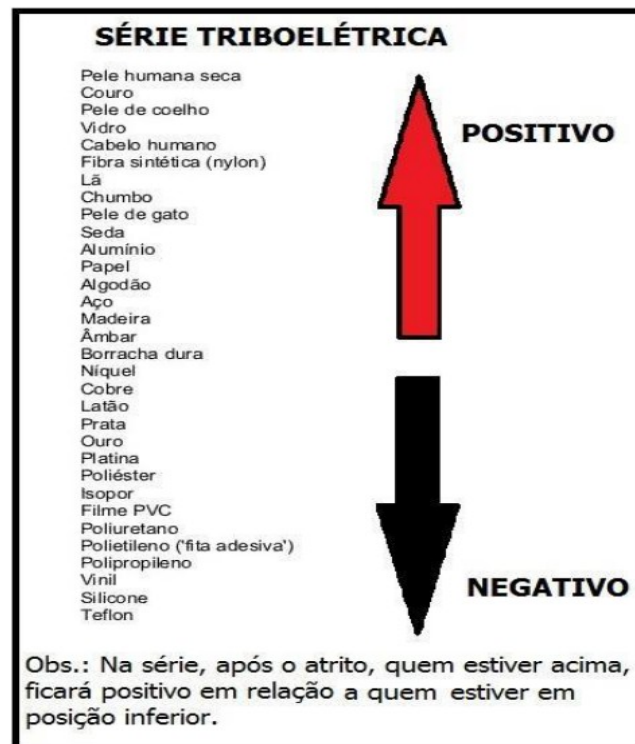
Figura 2 - Esquema de representação da série triboelétrica.

corpo para o outro. Intitula-se o corpo eletrizado negativamente, aquele que recebeu os elétrons, já o corpo que após a eletrização possui maior quantidade de prótons em relação ao número de elétrons, recebe o nome de corpo eletrizado positivamente. Para compreender a relação entre um determinado material e a carga que o mesmo poderá aderir após sofrer eletrização, consulta-se a tabela triboelétrica “que é uma relação ordenada de substâncias, de tal forma que o atrito entre duas quaisquer delas eletriza, positivamente, a substância que figura antes na série, negativamente, a substância que figura depois” (SANTOS, 2015, p. 12). A série triboelétrica é mensurada no roteiro das atividades, bem como, constitui a base de análise de cargas para diversas ocorrências desenvolvidas em cada experimento (Figura 2).