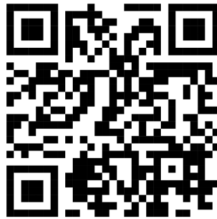
Figura 7 - Roteiro e resultados da Prática Experimental nº 4.

tradicionais de ensino. No entanto, na atualidade, diversas metodologias e abordagens oferecem novas perspectivas para o ensino de Física, incluindo Metodologias Ativas de Ensino e Aprendizagem, a abordagem CTSA, uso de TIC, recursos digitais, mapas conceituais e mentais, entre outras. O roteiro da prática e os resultados obtidos durante sua execução podem ser encontrados na Figura 7.